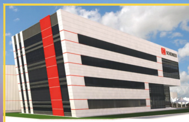
Agrandissement de DB Schenker Dubaï

À la pointe de la technologie, l'infrastructure sera équipée de panneaux solaires et sera certifiée TAPA pour les marchandises sensibles.